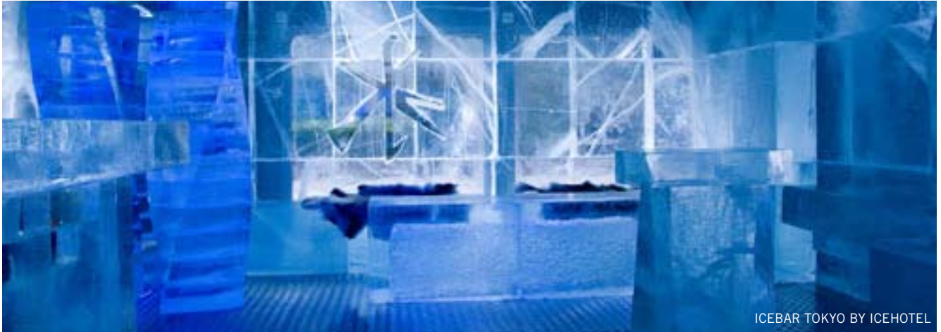
ICEBAR TOKYO BY ICEHOTEL